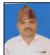
सह सम्पादक: डाँसीराम पौडेल प्रशासकीय अधिकृत

सम्पादन सहयोगी ना.सु. श्री सीता बन्जाडे क.अ. श्री बुद्ध बहादुर थापा क.अ. श्री सन्ध्या पौडेल