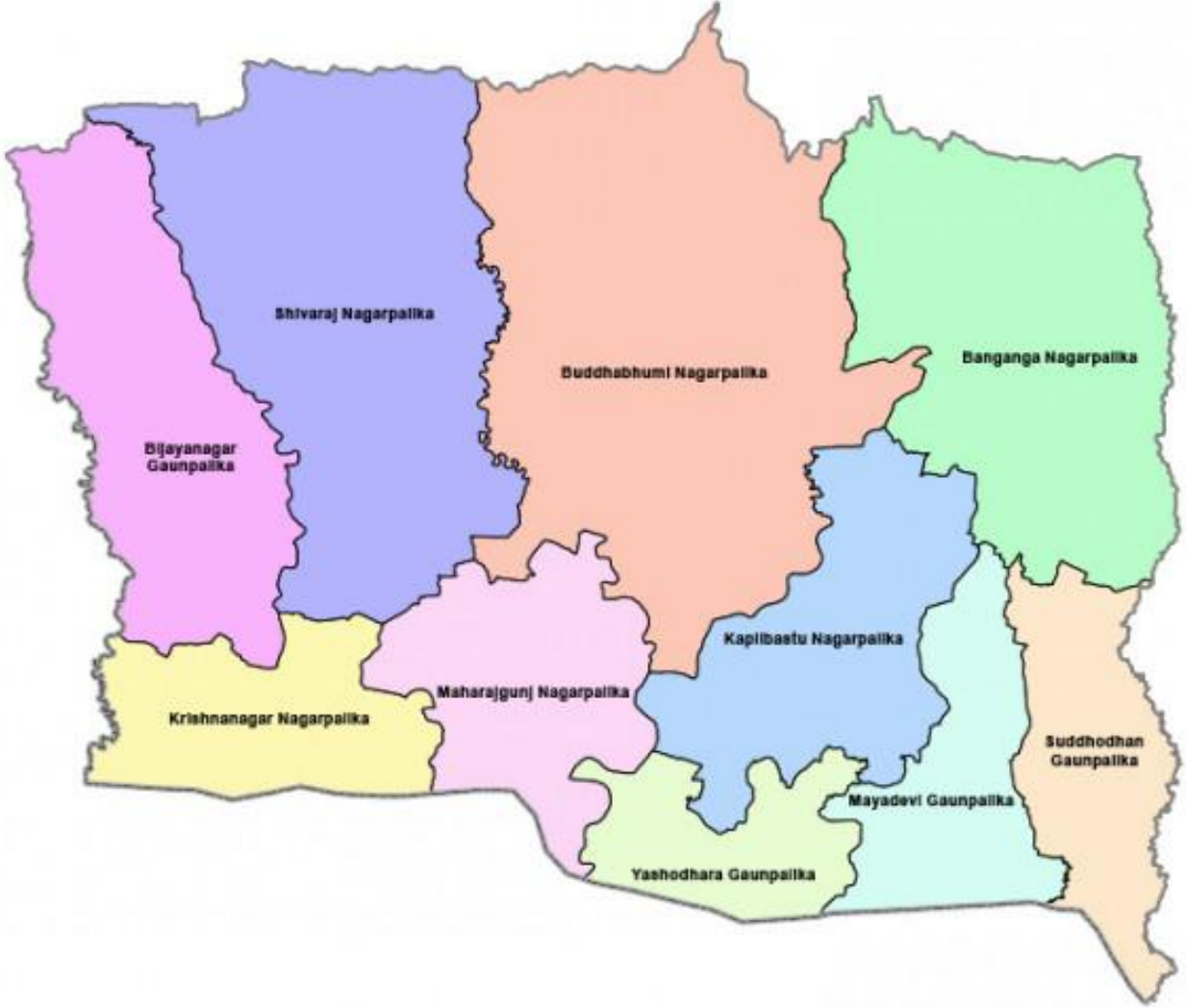
स्थानीय तहहरूको सीमाना सहितको कपिलवस्तु जिल्लाको नक्सा

राजनैतिक विभाजन : संघीय संसदका लागि ३ निर्वाचन क्षेत्र र प्रदेश सभाका लागि ६ निर्वाचन क्षेत्र रहेको यस जिल्लामा ६ नगरपालिका र ४ गाउँपालिका गरी १० स्थानीय तह रहेको छ ।