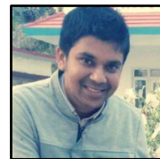
प्रधान सम्पादक: केशव लामिछाने प्रशासकीय अधिकृत